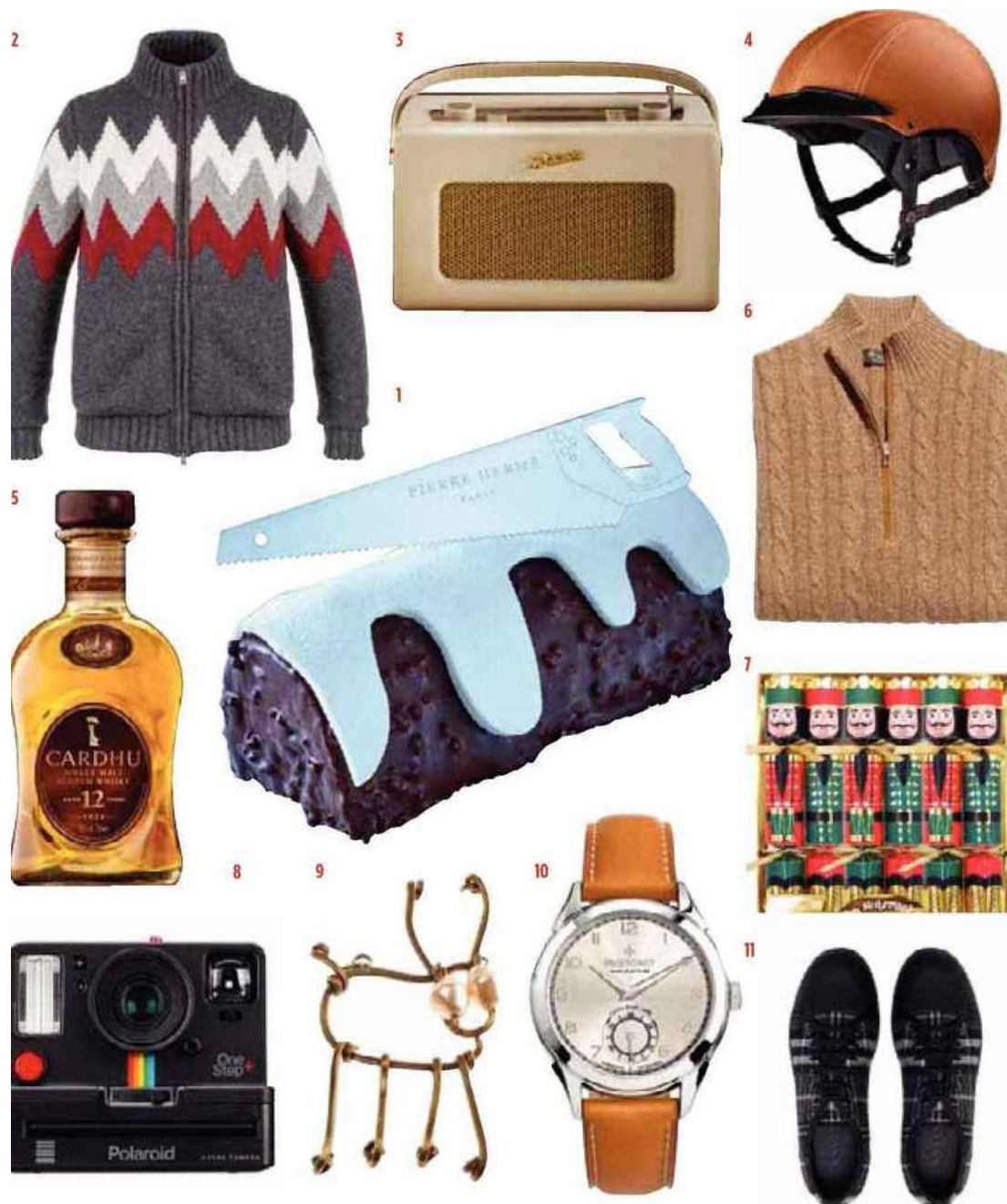
1. Bûche Orphéo, Pierre Hermé. 2. Veste en laine et tissu technique, Herno. 3. Radio Steam 3, Bluetooth, FM/DAB/DAB+, 30 stations pré-réglables, prise USB, Roberts. 4. Casque de vélo en cuir, Egide, en exclusivité au Bon Marché Rive gauche. 5. Single malt scotch whisky 12 ans d'âge, Cardhu. 6. Pull à col zippé en cachemire torsadé, Loro Piana. 7. Crackers de Noël Tasty G. aux Galeries Lafayette. 8. Appareil photo One step +, Polaroid. 9. Broche en laiton et détails en verre, Marni, en exclusivité pour Le Printemps. 10. Montre Royale à remontage manuel qui dispose d'une réserve de marche de 100 heures, fabrication française, Peignet. 11. Baskets en cuir, gomme et laine à carreaux, Lanvin.