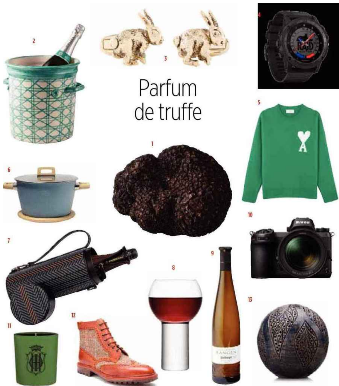
1. Truffe de saison, Maison de la truffe. 2. Champagne Boizel brut réserve dans un seau en céramique peint à la main, Casa Lopez. 3. Boutons de manchette en métal, Paul Smith. 4. Montre GPS multisports Tactix prête à tout portée par les équipes d'intervention du RAID, édition limitée RAID, Garmin. 5. Pull en laine, AMI. 6. Cocotte en acier, aluminium et bois, Maho Nabé. 7. Etui à bouteille de champagne isotherme en cuir tressé, ligne Toyz, Ermenegildo Zegna. 8. Verre à vin LSA sur www.yoox.com . 9. Coffret comprenant un vin d'Alsace pinot gris et un morceau de mimolette affinée, sélection fromagerie Cantin, Wolfberger. 10. Appareil photo Z6 universel au format FX, 24,5 millions de pixels effectifs, Nikon. 11. Bougie parfumée Campagne, Sisley. 12. Bottines en cuir et tissu, Bowen. 13. Boule parfumée en terracotta senteur mûre et musc, L'Artisan parfumeur.