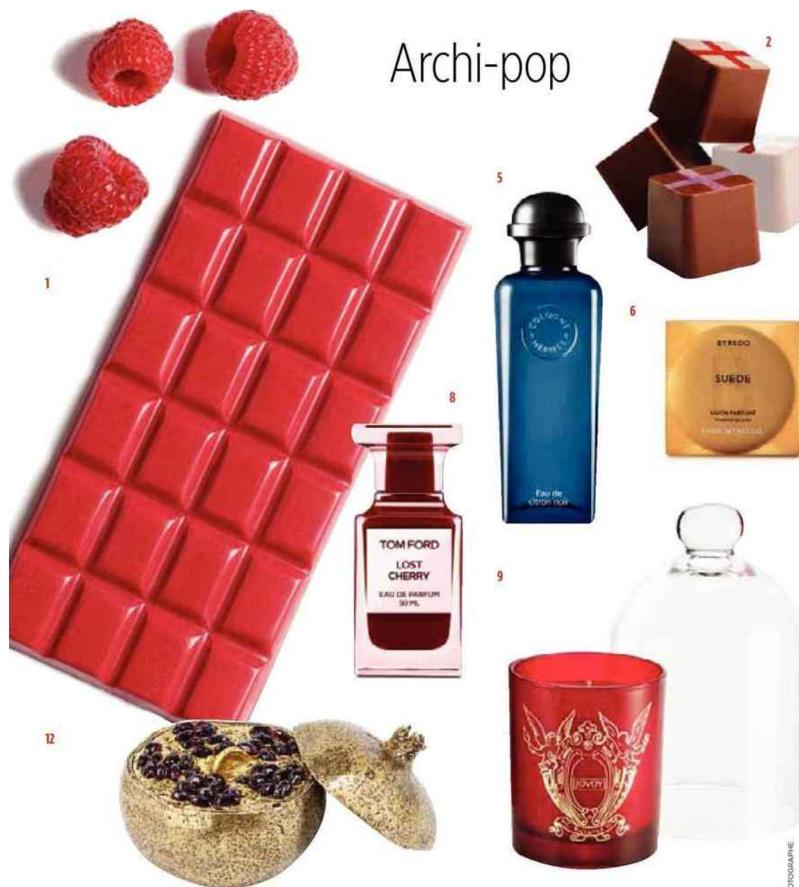
1. Tablette de chocolat framboise croustillante, Sève. 2. Coffret de six bouchées saveur pralinée, Pierre Marcolini. 3. Blender, gamme Désire, Russel Hobbs. 4. Confiture figue, miel et huile d'olive par le chef Akrame Benallal, Confiture parisienne. 5. Cologne Eau de citron noir, Hermès. 6. Savon parfumé, Byredo. 7. Caramels au beurre salé, 140 grammes, Cyril Lignac. 8. Eau de parfum Lost Cherry, Tom Ford. 9. Coffret de bougies parfumées et cloche en verre, Jovoy. 10. Eau de parfum Rose rouge, ligne Collection extraordinaire, Van Cleef & Arpels. 11. Desserte Chess en bois massif ou fibre de verre et résine polyester laquée, design Marcel Wanders, Roche Bobois. 12. Boîte Grenade Harumi en laiton oxydé et verni et ornements grenat, design Harumi Klossowska de Rola, Goossens. 13. Rangement Componibili, matière plastique, habillé par Double J d'après les motifs du soyeux cômois Mantero, Kartell. 14. Kit découverte de pâtisserie Pixbox, Pixcake.