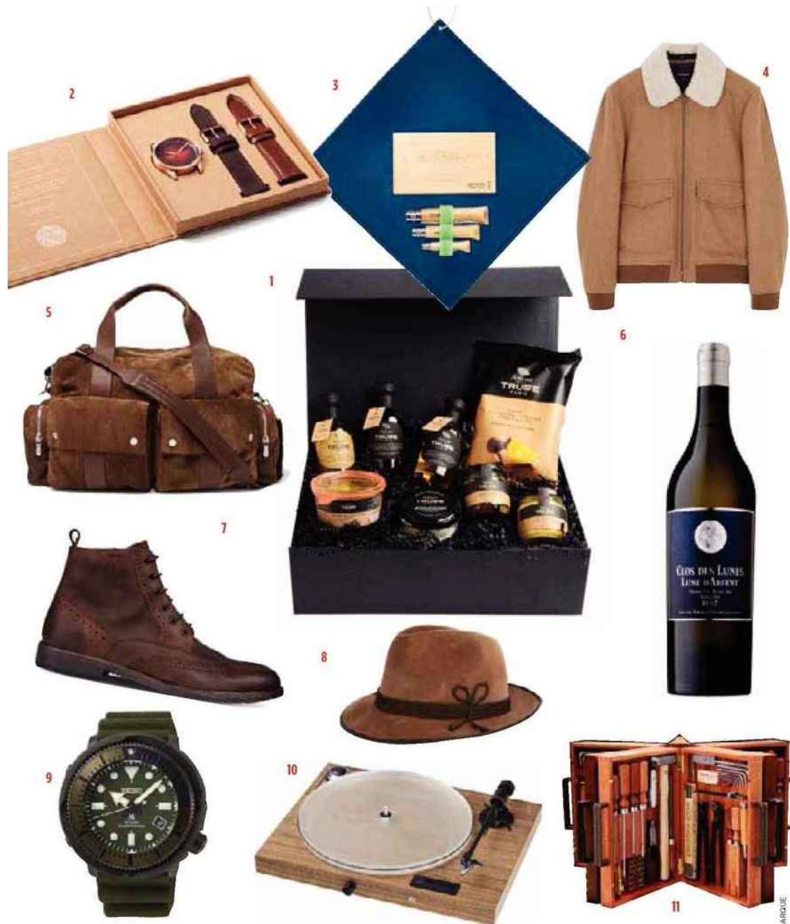
1. Coffret dégustation, Artisan de la truffe Paris. 2. Montre écologique qui se recharge à l'énergie solaire (trois heures d'exposition, six heures d'autonomie), un bracelet fabriqué à partir de déchets plastiques collectés en mer, Awake. 3. Kit Cuisine nomade comprenant trois couteaux, une planche à découper et une nappe, Opinel. 4. Blouson en laine et col en mouton retourné, Balibaris. 5. Sac de voyage en veau velours et cuir, Brunello Cucinelli sur www.mrporter.com . 6. Vin blanc sec de Bordeaux 2017, Clos des lunes lune d'argent. 7. Boots lacés en cuir à bout fleuri, Geox. 8. Chapeau en feutre et garniture tressée, Mettez. 9. Montre de plongée Prospex Street à énergie solaire inspirée des Seventies pour s'immerger dans la ville, Seiko. 10. Platine vinyle Juke Box S2, châssis en bois, Pro-Ject. 11. Boîte à outils en bois, Wohngest au Conran Shop.