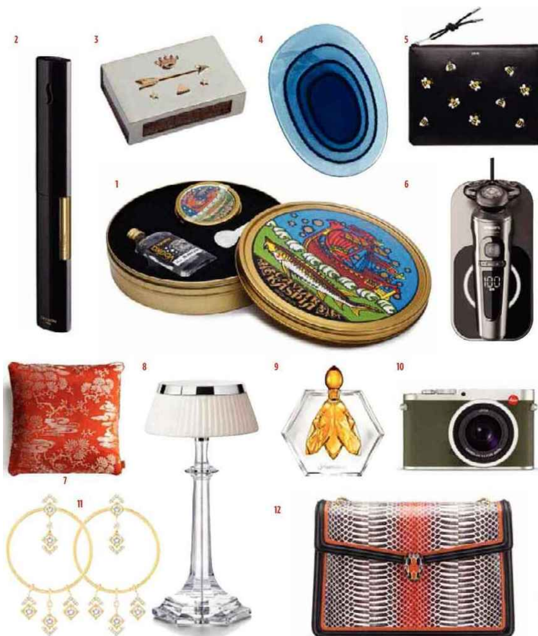
1. Kit de dégustation comprenant 50 grammes de caviar Impérial Baeri, une mignonnette de vodka blanche et une petite cuillère en nacre, Caviar Kaspia. 2. Briquet de table, Cire Trudon et S. T. Dupont. 3. Boîte d'allumettes en argent, or jaune, émail et diamants, Foundrae Jewelry, en exclusivité chez Mad Lords. 4. Set de trois plateaux Softpond en cristal, design Nendo, Swarovski. 5. Pochette en cuir, motif abeille embossé dessiné par Kaws, Dior. 6. Version Prestige du rasoir série 9000 étanche. Un tout nouveau système de coupe avec deux têtes de rasage : une à lames oscillantes et l'autre à lames fixes. L'appareil se recharge sur un socle à induction pouvant accueillir un smartphone, Philips. 7. Coussins en soie, velours, cuir ou lin, design India Mahdavi, Poltrona Frau. 8. Lampe Bon Jour Versailles, design Philippe Starck, Baccarat et Flos. 9. Flacon Abeilles anniversaire réalisé par Baccarat, Guerlain. 10. Appareil photo Q numérique compact plein format, série limitée, Leica. 11. Créoles My Stouls en or jaune et diamants, Messika Paris. 12. Sac à main Serpenti Forever en peau exotique et cuir, Bulgari.

SP (X10) - MARSHA OWETT - ALESSIO D'ARIELLO