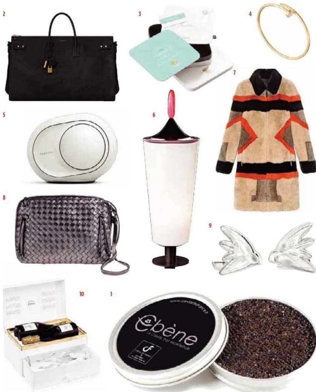
1. Caviar Ebène, Caviar de France. 2. Sac de voyage Sac de jour en cuir grainé, Saint Laurent par Anthony Vaccarello. 3. Coffret-cadeau avec douze nouvelles thématiques pour l'e-coffret : de la vie de château à la découverte des tables étoilées en passant par des séjours à la montagne ou dans les vignes, Relais & Châteaux. 4. Bracelet Juste un clou petit modèle en or jaune, Cartier. 5. Enceinte connectée Phantom Reactor, Devialet au Bon Marché Rive gauche. 6. Objet de décoration en verre soufflé à la main, The Lou collection, design Aldo Cibic, Venini. 7. Manteau en patchwork de fourrure, Longchamp. 8. Sac Nodini en cuir tressé, Bottega Veneta, en exclusivité au Printemps. 9. Boutons de manchette Hirondelle en cristal, Lalique. 10. Coffret cuvée Louise 2006 comprenant deux bouteilles et deux flûtes, Pommery.

SP (X8) - D. COMAS - PALKST// MANIGAND - VENNII - FRED FURIOOL