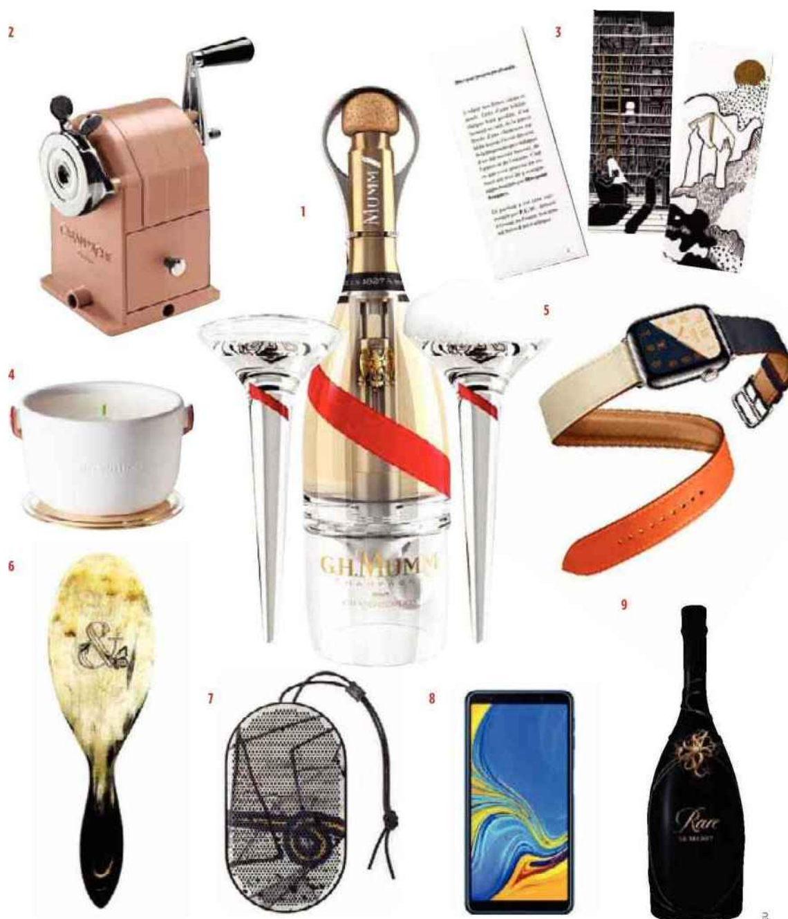
1. Cuvée Grand Cordon Stellar avec flûtes à déguster en apesanteur, G. H. Mumm. 2. Taille crayon de bureau en métal, Caran d'Ache. 3. Coffret de 5 marque-pages décorés à la main, Ex-Libris, sur www.morganerospars.com . 4. Bougie parfumée, corps en céramique et anse en cuir, design Marc Newson, Louis Vuitton. 5. Montre connectée Serie 4 à bracelet double tour, Apple Watch, Hermès. 6. Brosse à cheveux Duchesse en corne de vache, gravure personnalisable Guêpes & papillons, www.guepesetpapillons.fr . 7. Enceinte portable Beoplay P2, design David Lynch, Bang & Olufsen. 8. Smartphone Galaxy A7 avec écran panoramique 6 pouces, Samsung. 9. Cuvée Le Secret, flacon décoré d'or, de platine et de pierres précieuses par le joaillier Mellerio, Rare Champagne.