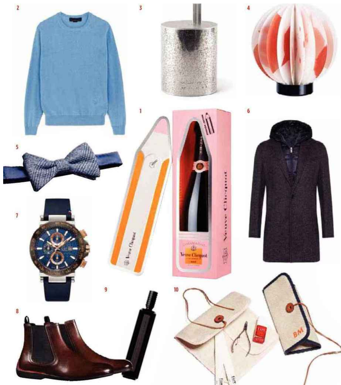
1. Coffret Magnetic Message avec une bouteille de champagne rosé, Veuve Clicquot. 2. Pull en cachemire Re.Verso obtenu à partir de déchets de cachemire non utilisés lors de la production, Stella McCartney. 3. Enceinte sans fil Lexon, aux Galeries Lafayette. 4. Diffuseur en papier parfumé Un air d'Hadrien, Goutal. 5. Nœud papillon en laine à motif prince-de-galles, Izac. 6. Manteau en laine à doudoune à capuche amovible, Boggi. 7. Dans la collection Capsule, cette montre féminine, conception française, mouvement suisse, édition limitée à 1 000 exemplaires, Gc. 8. Bottines en cuir, semelle gomme et carbone, ligne Ferrari, Berluti. 9. Eau de parfum Cuir mauresque, collection Gratte-ciel, Serge Lutens. 10. Kit de manucure personnalisable comprenant une trousse en toile, vernis à ongles, limes, L/Uniform et Kure Bazaar au Bon Marché Rive gauche. SP (X10)