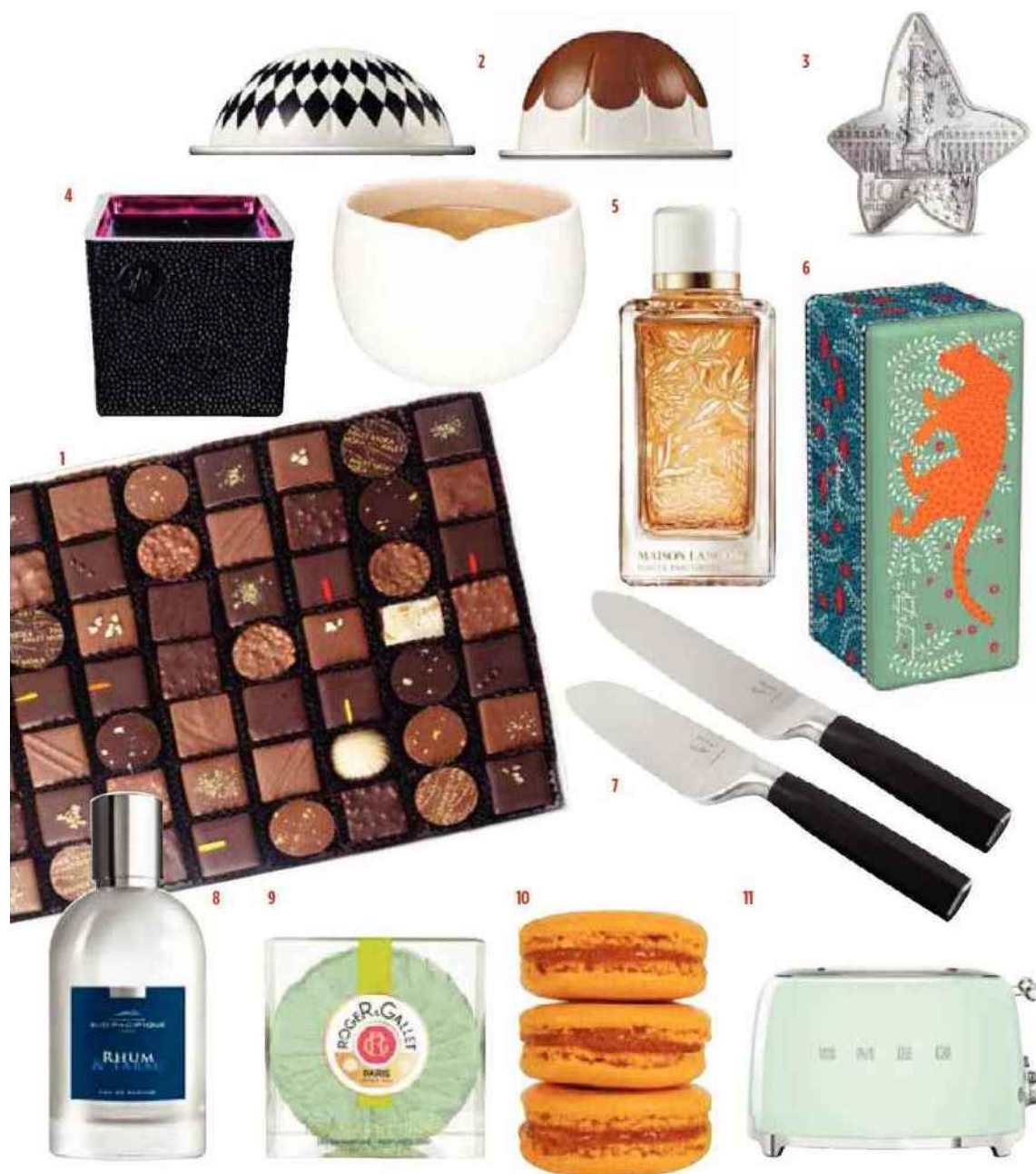
1. Assortiment de différents bonbons de chocolat (ganache, pralinés), 495 grammes, A la mère de famille. 2. Capsules de café nouvelles saveurs et tasse à café, ensemble imaginé par India Mahdavi, Nespresso. 3. Pièce de 10 euros Argent BE, 5 000 exemplaires, Monnaie de Paris et Boucheron. 4. Bougie parfumée Armagnac Ardente, Amanda de Montal. 5. Eau de parfum Orange-bigarade, collection Grands crus, Lancôme. 6. Boîte de biscuits, design Kenzo Takada, une partie du montant des ventes sera reversée à l'association Toutes à l'école, Delacre. 7. Set de trois couteaux de cuisine en acier inoxydable, design Thierry Marx, Habitat. 8. Eau de parfum Rhum & Tabac, Comptoir Sud Pacifique. 9. Savon parfumé feuille de figuier, Roger & Gallet. 10. Macaron parfum argousier, Ladurée. 11. Grille-pain TSF03 quatre fentes, Smeg.