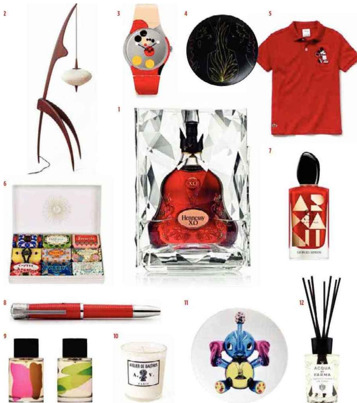
1. Cognac Hennessy XO & Ice, l'étui se transforme en seau à glace, Hennessy. 2. Lampadaire Mante religieuse, frêne, chêne ou noyer, acier et verre, réédition du modèle de 1950 dessiné par le bureau de style Rispal. 3. Quand l'artiste britannique Damien Hirst célèbre avec une Swatch en édition limitée les 90 ans de la célèbre souris créée par Walt Disney, New Gent Mirror Spot Mickey, Swatch. 4. Assiette en porcelaine Coupe Orphée et Eurydice Jean Cocteau, Raynaud. 5. Polo enfant en piqué de coton, édition anniversaire Mickey, Lacoste. 6. Coffret de savons parfumés, Claus Porto, en exclusivité au Printemps. 7. Eau de parfum Si Passione, Giorgio Armani. 8. Stylo plume, hommage à James Dean, Special Edition, Montblanc. 9. Flacons décorés, édition limitée, Editions de parfums Frédéric Malle. 10. Bougie Atelier de Balthus, Astier de Villatte. 11. Assiette en porcelaine décorée Jeff Koons, Bernardaud. 12. Diffuseur d'ambiance Colonia, design Clym Evernden, Acqua di Parma.